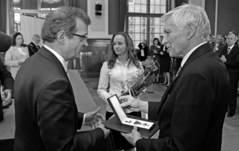
Ambasador Węgier odznaczył profesorów UAM

W dniach poprzedzających obchody Dnia Przyjaźni Polsko-Węgierskiej, którego gospodarzem w 2011 roku był Poznań, na UAM odbyła się międzynarodowa konferencja „Pomiędzy językami Europy Środkowo-Wschodniej”, współfinansowana przez Międzynarodowy Fundusz Wyszehradzki